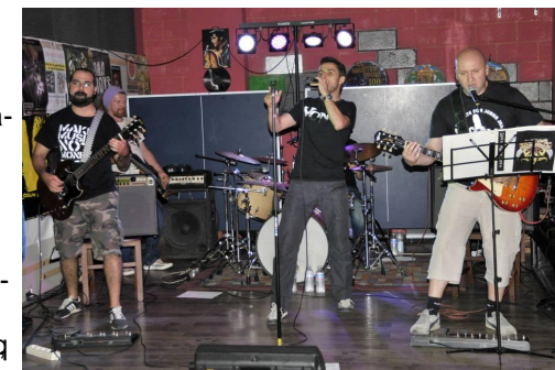
Love Hate Love, cover band degli Alice