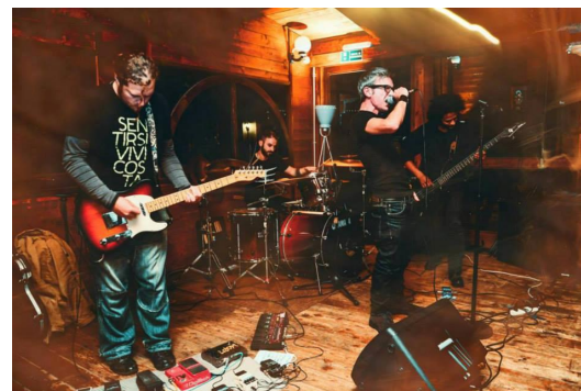
QuellUomo, gruppo noise-punk biellese