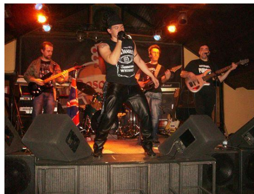
I Mephitic in azione al Fuori Onda di Cura