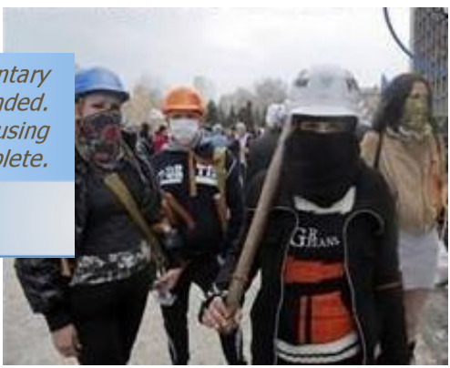
Partigiani filo-russi in azione a Donesk

Click Here to upgrade to Unlimited Pages and Expanded Features