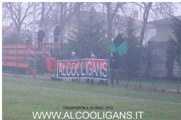
TRASFERTA A DORNO (PV) WWW.ALCOOLIGANS.IT