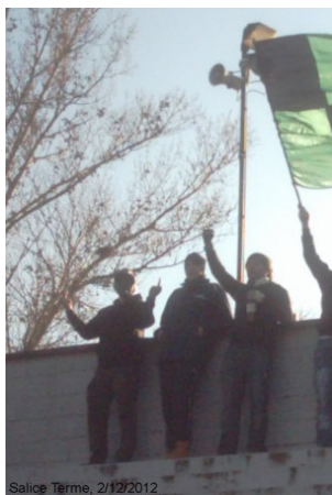
Salice Terme, 2/12/2012