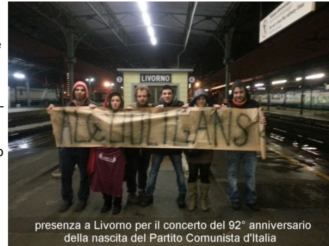
presenza a Livorno per il concerto del 92° anniversario della nascita del Partito Comunista d'Italia

Ciclismo: sport che ci ha aggregato più di tutti nel Dopoguerra: Coppi, Bartali, fino ad arrivare a Merx, Gimondi, Moser, Saronni, Bugno e Pantani... ULTIMI BALUARDI... GENTE Abituata a pedalare con NEVE, vento, pioggia, crampi, vomito, nausea... che prendeva bottigliette d'acqua dal pubblico lungo le strade... gente che Mondiale, Milano-San Remo, Olimpiade, Giro d'Italia e Tour de France erano tutti obiettivi primari della stessa stagione.. gente che per prima cosa veniva il sacrificio, poi la gloria e poi i $oldi.. ed oggi???